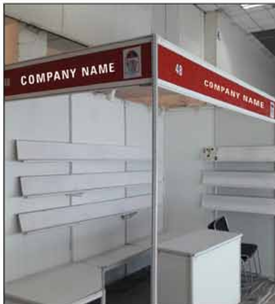
STALL 3MX2M size