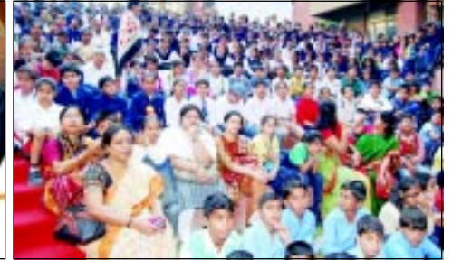
उद्घाटन सत्र में उपस्थित जनसमूह का एक दृश्य

प्रति वर्ष की भांति इस वर्ष भी नेशनल बुक ट्रस्ट, इंडिया द्वारा देश भर में आयोजित किए जाने वाले राष्ट्रीय पुस्तक सप्ताह का ट्रस्ट-परिसर, नेहरू भवन, नई दिल्ली में 14 नवंबर, 2011 को उद्घाटन किया गया। प्रख्यात शिक्षाविद् एवं वर्तमान में योजना आयोग में सदस्य, डॉ. नरेंद्र जाधव ने एक सप्ताह तक चलने वाले इस राष्ट्रीय बाल पुस्तक एवं गतिविधि मेला का उद्घाटन किया।