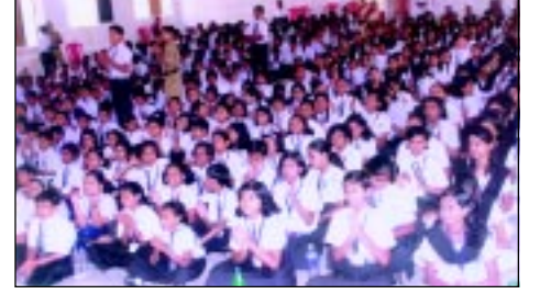
रावेनशॉ कॉलेजिएट के छात्रगण