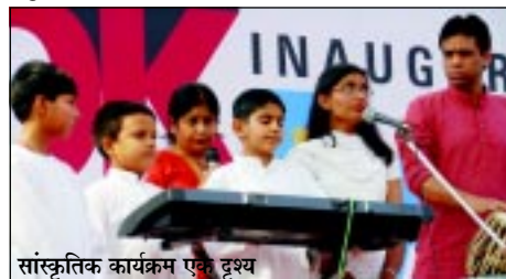
सांस्कृतिक कार्यक्रम एक दृश्य