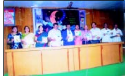
पुस्तक लोकार्पण का एक दृश्य