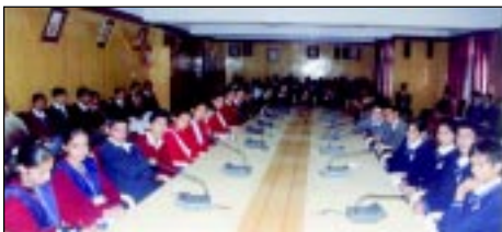
क्विवज में भाग लेते स्कूली बच्चे